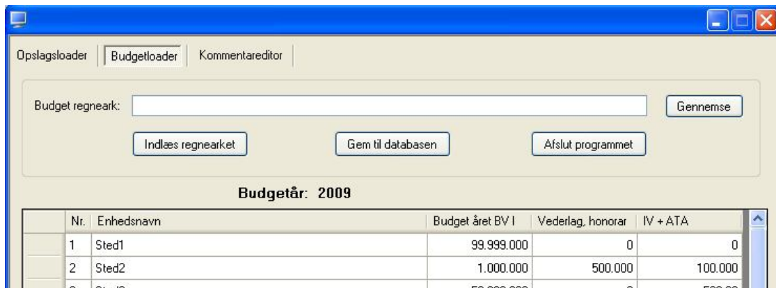
Fig. 8: Indlæsning af budgettal (Budgetloader)