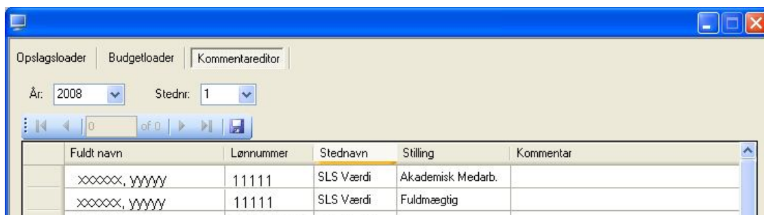
Fig. 9: Redigering af kommentarfelter (Kommentareditor)