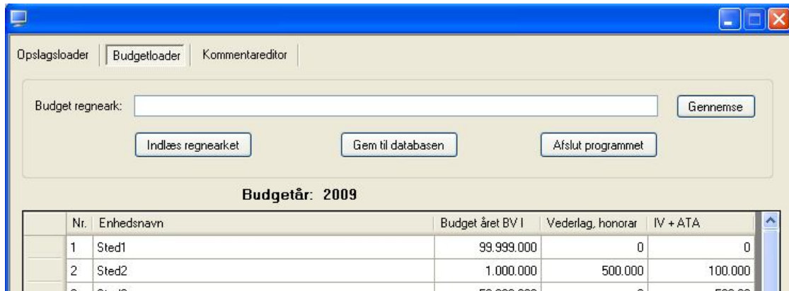
Fig. 8: Indlæsning af budgettal (Budgetloader)